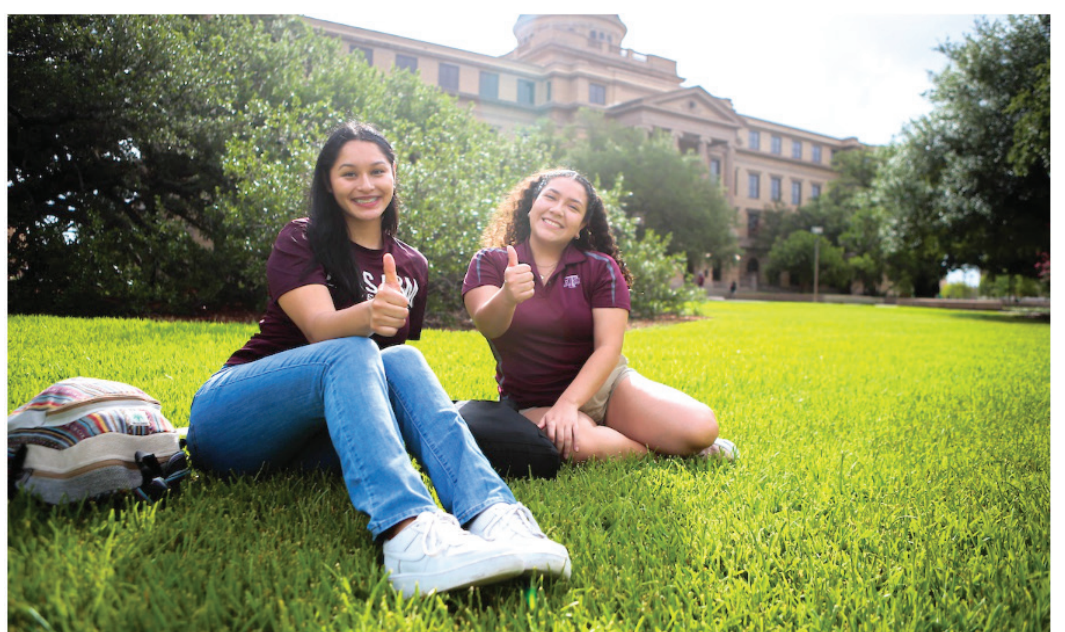
QS examined 1,500 higher education institutions in the U.S. and around the world.

Información y detalles: https://today.tamu.edu/2024/04/16/qs-world-university-rankings-place-texas-am-programs-in-top-10/